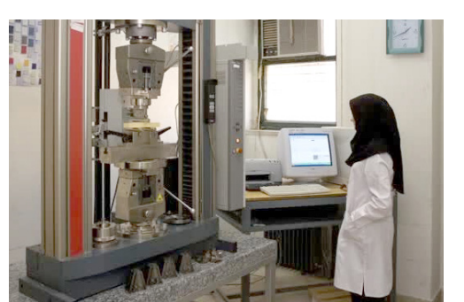
رئیس دانشکده فنی و مهندسی خبر داد: