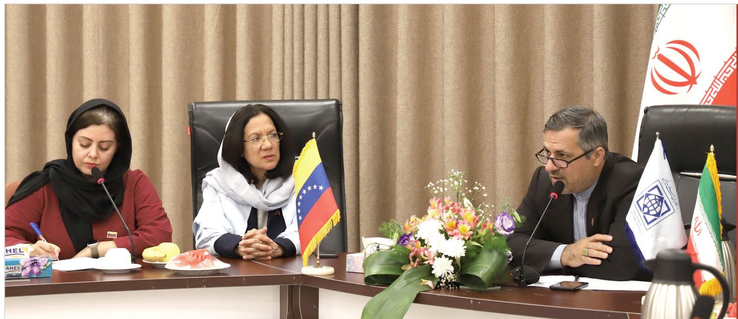
در نشست رئیس دانشگاه بین المللی امام خمینی (ره) با وزیر مختار سفیر کشور ونزوئلا تأکید شد: