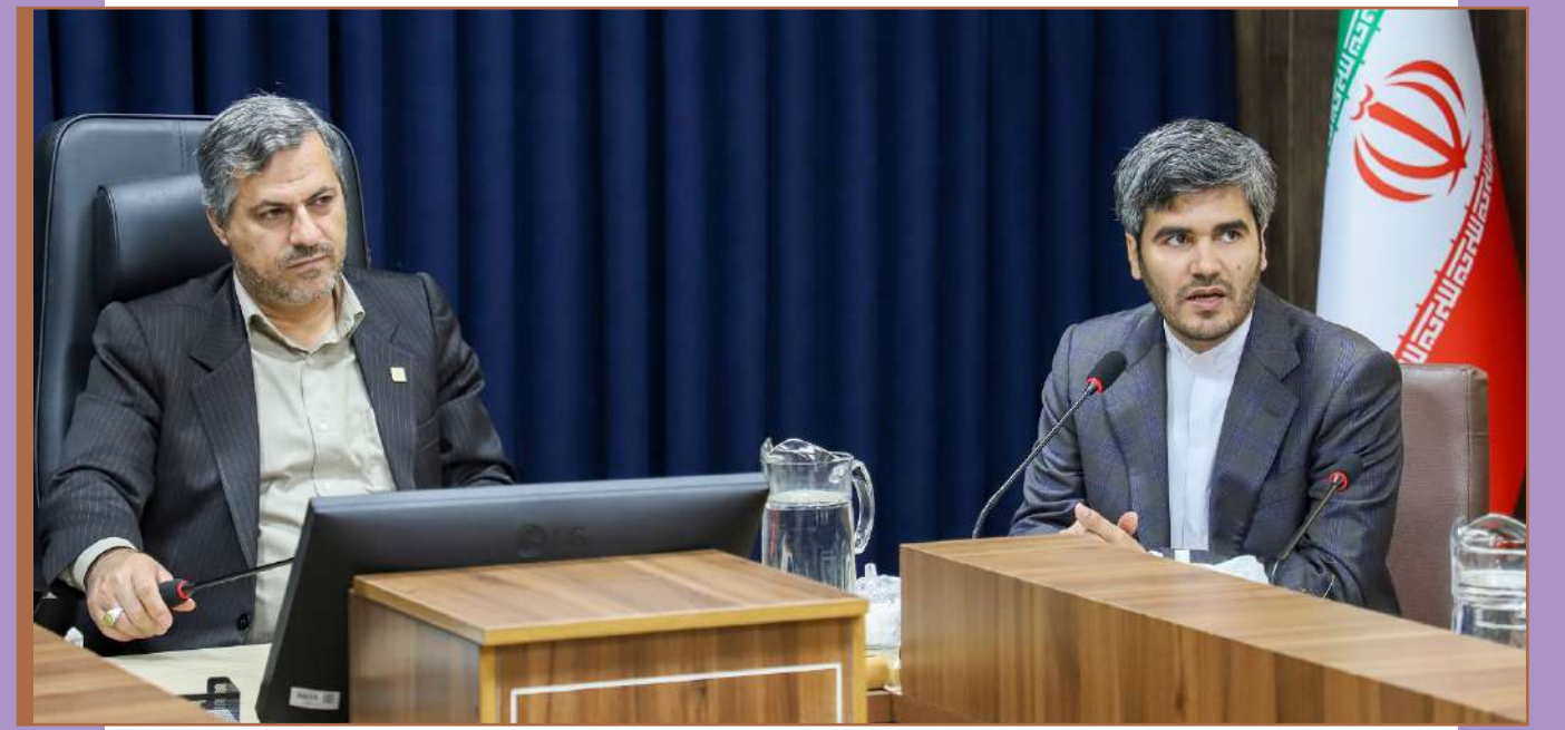
در نشست رئیس دانشگاه بین المللی امام خمینی (ره) با مدیران وزارت امور خارجه عنوان شد:

این مسئول بیان کرد: برای ارتقا سطح کیفی مرکز زبان فارسی مدل های مختلف بورسیه در قالب بورسیه آموزشی ۱۰۰ درصدی، بورسیه آموزشی ۵۰ و ۲۵ درصدی تعریف شده است و دانشجویانی که ارتقا تحصیل داشته باشند از ارتقا بورسیه نیز بهره مند می شوند که نتایج این اقدامات کیفی در طولانی مدت بروز و ظهور پیدا می کند.