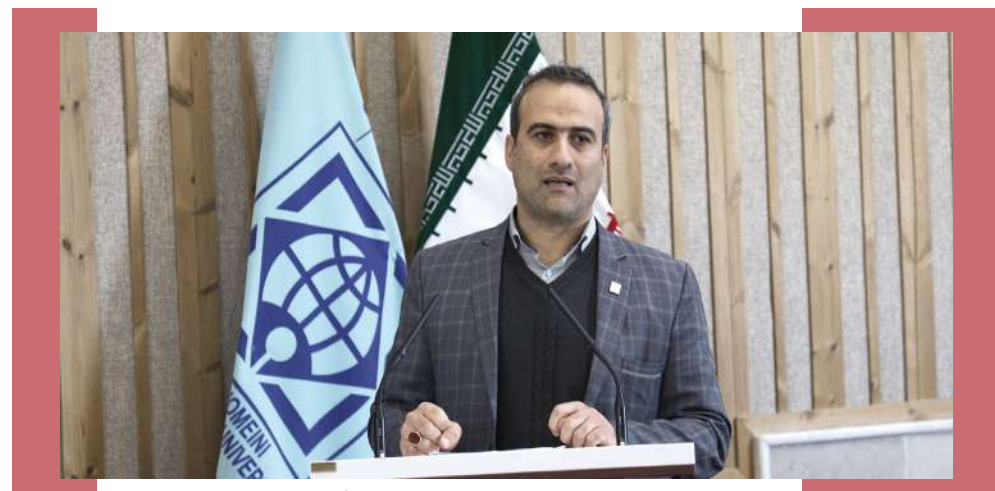
معاون پژوهشی و فناوری دانشگاه: