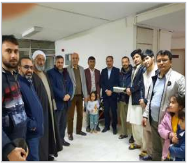
به مناسبت عید سعید میثاق صورت گرفت: دیدار صمیمانه رئیس دانشگاه با دانشجویان غیرایرانی

به مناسبت عید سعید میثاق رسول اکرم (ص) رئیس دانشگاه با حضور در محضره خواجه‌های دانشگاه ضمن تبریک عید بزرگ مسلمانان با دانشجویان غیرایرانی دیدار و گفتگو کرد.