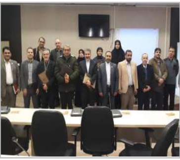
دو اولین نشست میزهای همکاری علمی و بین‌المللی بررسی شد

نشریه الکترونیکی دانشگاه بین‌المللی امام خمینی (ره)