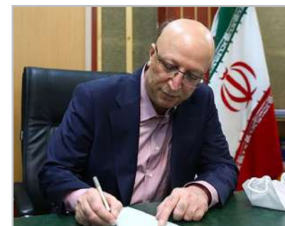
انتصاب رئیس دانشگاه به عنوان «رئیس ستاد هماهنگی و پشتیبانی راهیان پیشرفت دانشجویی استان قزوین»