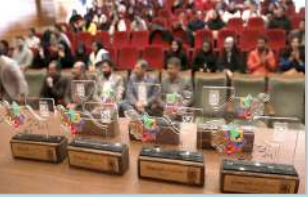
رئیس دانشگاه در مراسم اختتامیه جشنواره درون دانشگاهی حرکت:

انجمن‌های علمی عصری تأثیرگذار در آینده شغلی دانشجویان