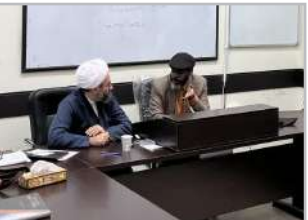
پژوهشگر کویابایی فلسفه اسلامی در نشست هم‌اندیشی:

در فضای اروپا، جریان برجسته‌ای وجود دارد که از جریان اسلامی استقبال می‌کند