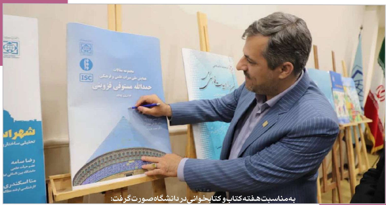
به مناسبت هفته کتاب و کتابخوانی در دانشگاه صورت گرفت: