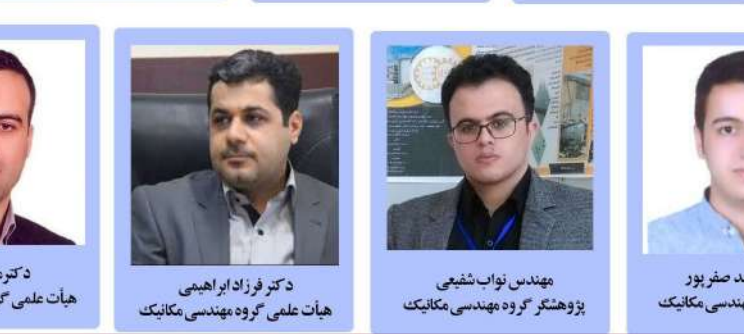
بر اساس اطلاعات پایگاه شاخص‌های اساسی علم (ESI):