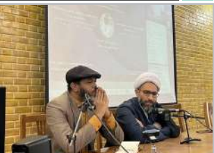
پژوهشگر کویابایی فلسفه اسلامی در نشست هم‌اندیشی فرهنگ آمریکای لاتین:

فرهنگ ایرانی با فرهنگ آمریکای لاتین ارتباط تاریخی و زبانی فراوانی دارد