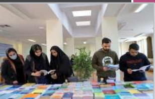
به مناسبت هفته کتاب و کتابخوانی در دانشگاه برگزار شد: