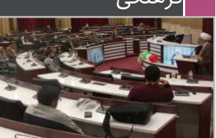
رئیس دانشگاه در نشست عهد خدمت ویژه مدیران دانشگاه خبر داد:

طرح درآمد و استاد نمونه فرهنگی در دستور کار دانشگاه قرار دارد