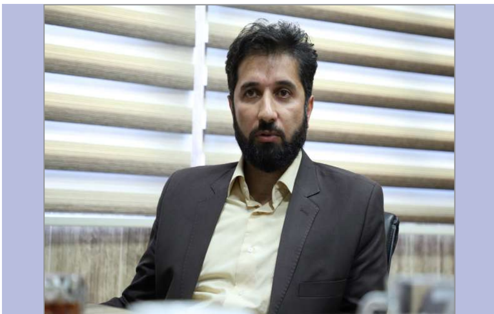
معاون فرهنگی دانشگاه:

رئیس دانشگاه بین المللی امام خمینی (ره) با اشاره به افزایش تعداد دانشجویان وارد رشته و زبان آموز غیرایرانی در یکسال گذشته تشریح کرد: با برنامه ریزی ها و سیاست گذاری هایی که داشتیم در آینده ای نزدیک شاهد افزایش بیشتر دانشجویان بین المللی و تنوع ملیت های مختلف خواهیم بود.