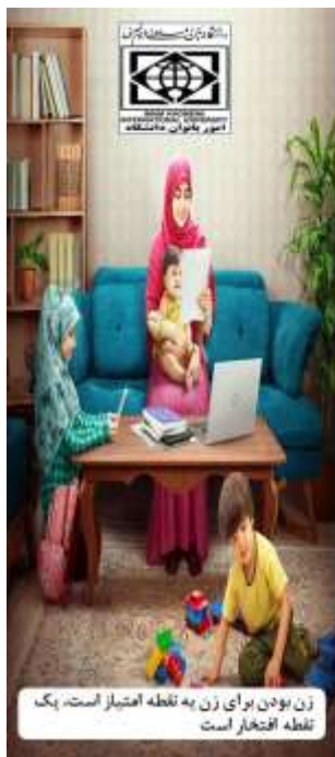
زن بودن برای زن به نقطه امتیاز است، یک نقطه افتخار است