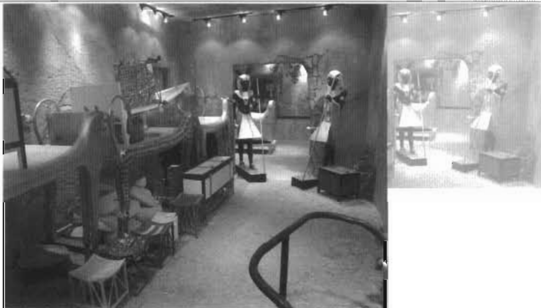
اشیاء داخل موزه توت آنخ آمون