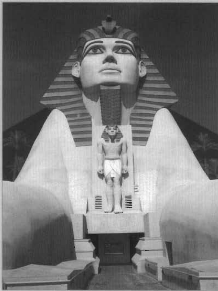
ورودی پر ابهت هتل لوکسور